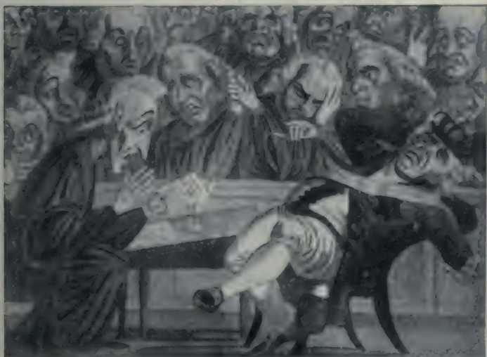
Lecture de la nouvelle de l'Entrée des Français à Madrid, par le Premier ministre d'Angleterre au roi Georges et à son conseil Caricature du temps.

Depuis qu'il a quitté Paris, Murat fait un beau rêve. Sa nomination de lieutenant de l'Empereur l'a surpris sans qu'aucune instruction politique précise et limite ses ins-